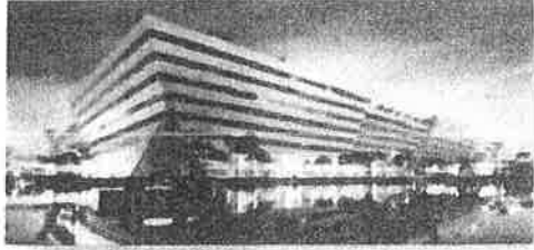
สิ่งพิมพ์ที่ ๑ ๒๕๖๒๒ ความปลอดภัยของผู้บริโภค