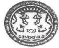
สภามหาวิทยาลัยบูรพาวิทยาเขตจันทบุรี