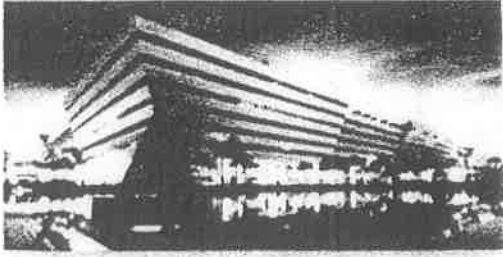
สภามหาวิทยาลัยบูรพาวิทยาเขตจันทบุรี