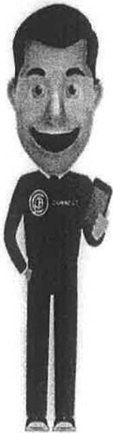
คุยกับพี่ปกป้อง Chatbot พร้อมให้บริการ

ทั้งนี้ ยังมี “พี่ปกป้อง” เป็น chatbot ที่ สคบ.ได้พัฒนาขึ้นมา เพื่อเป็นผู้ช่วยให้คำปรึกษาผู้บริโภค สามารถคอยสอบถามเรื่องด้านธุรกิจ ออกกำลังกาย, ด้านธุรกิจสายการบิน, ด้านธุรกิจโทรศัพท์เคลื่อนที่, ด้านธุรกิจให้เช่าซื้อรถยนต์, ธุรกิจการให้กู้ยืมเงิน, ช่องทางร้องเรียน, ความหมายและติดต่อหน่วยงาน, ด้านฉลาก, ด้านโฆษณา, ด้านหมู่บ้านจัดสรร, ด้านธุรกิจประกันภัย, ด้านธุรกิจบัตรเครดิต, ด้านธุรกิจขายอาคารชุด, ด้านธุรกิจการให้เช่าที่อยู่อาศัย