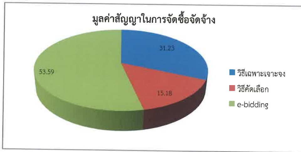
กราฟแสดงจำนวนงบประมาณในการจัดซื้อจัดจ้างในปีงบประมาณ พ.ศ.๒๕๖๖

ประกาศ ณ วันที่ ๗ เดือน พฤษภาคม พ.ศ. ๒๕๖๗