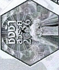
โรงเรียนท่าข้ามพิทยาคม รางวัล ชิงช้าสวรรค์