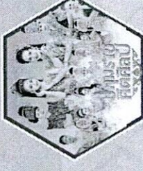
หมอลำคอนเสิร์ตปทุมราชคัลลศิลป์ พร้อมทีมงาน